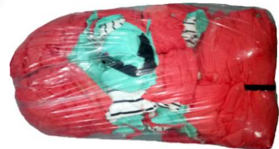
写真3：15kg 種類商品入れビニール袋