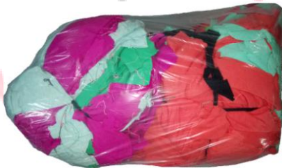
写真2：10kg 種類商品入れビニール袋