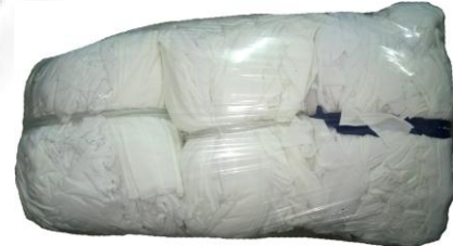
Hình 3: Túi thành phẩm 15kg