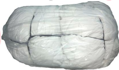
Hình 2: Túi thành phẩm 10kg