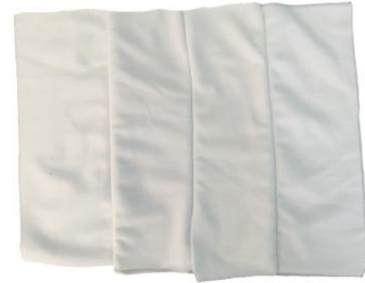
Hình 1: Vải lau trắng may 3