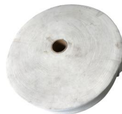
Hình 3: Cuộn thành phẩm (mặt hông)

Do tính chất và mục đích sử dụng của mỗi ngành nghề khác nhau, nên nhà máy luôn điều chỉnh sản phẩm cho phù hợp với yêu cầu của từng khách hàng nhằm đáp ứng khách hàng một cách tốt nhất, giúp cắt giảm chi phí trong sản xuất.