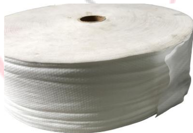
Hình 2: Cuộn thành phẩm 10kg